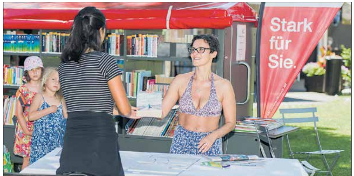
Die AK-Bibliothek öffnet im Rahmen der Aktion „Badebuch“ im Sommer ihre Pforten für rund zwei Monate auch im Erlebniswaldbad in Feldkirch.