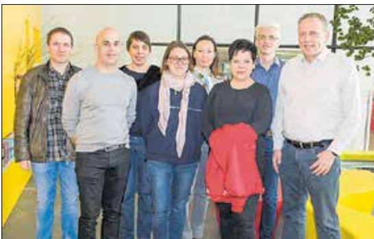
Betriebsräte informieren sich vor Ort über die Serviceleistungen der AK Vorarlberg.

Regelmäßig bekommt die AK Vorarlberg Besuch von Schülern, Lehrlingen oder Betriebsräten. Bei diesen Treffen bekommen die Besucher Einblick in unsere Arbeit, lernen das Haus und unsere Mitarbeiter kennen. Damit sollen das breite Serviceangebot der Arbeiterkammer publik gemacht werden.