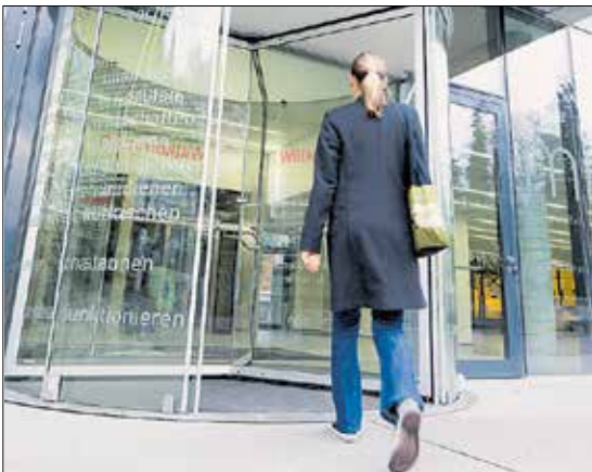
Anlaufstelle für Ratsuchende in Feldkirch, die AK-Zentrale an der Bärenkreuzung.

Der Hauptsitz der AK Vorarlberg befindet sich direkt an der Bärenkreuzung in Feldkirch. Hier können alle von der Arbeiterkammer angebotenen Serviceleistungen der Fachabteilungen in Anspruch genommen werden. Insgesamt kümmerten sich im Jahr 2016 127 AK-Mitarbeiterinnen und Mitarbeiter um die Anliegen der Ratsuchenden.