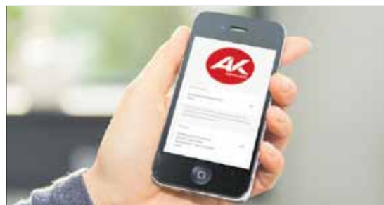
Die Konsumentenberatung ist jetzt auch über WhatsApp erreichbar.

Die Konsumentenberatung der AK Vorarlberg ist jetzt per „WhatsApp“ kontaktierbar. Durch diesen niedrigschwelligen Zugang soll die Beratung bei Problemen noch leichter in Anspruch genommen werden können.