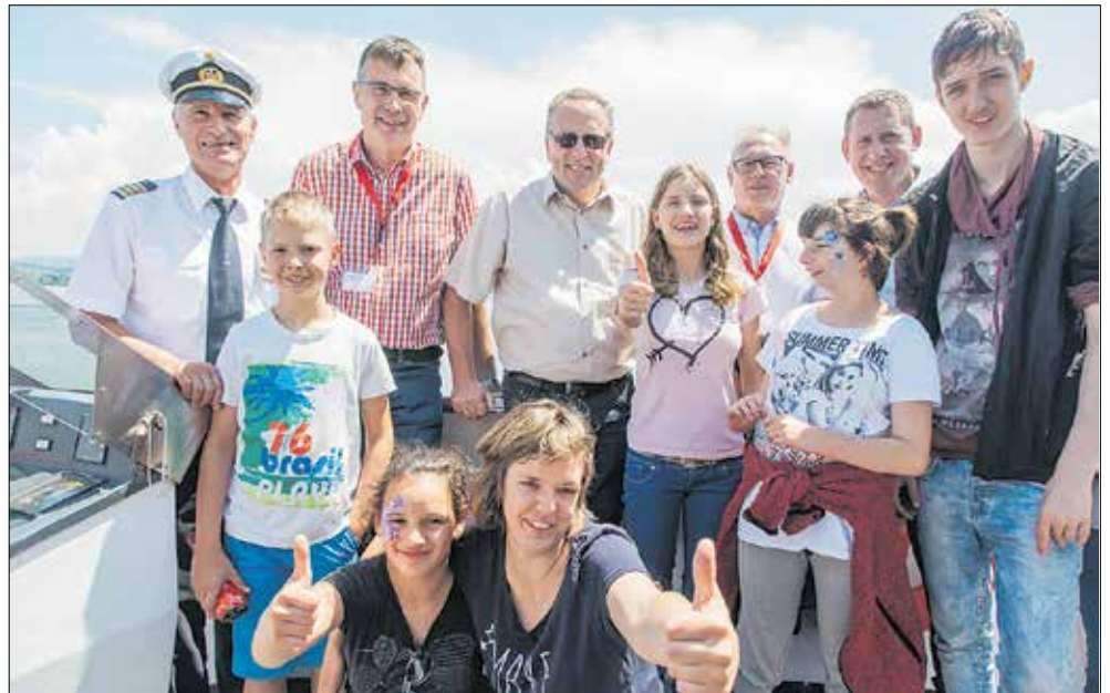
Rund 740 Menschen mit Handicap mit Betreuern nahmen an der Fahrt auf den Bodensee teil.

Rund 740 Betreute und Betreuer genossen die 37. AK-Schiffsausfahrt auf den Bodensee mit dem MS „Vorarlberg“. Dabei werden Menschen mit Handicap auf eine vergnügliche Fahrt mit Kinderschminken, Zaubern und einer kleinen Abordnung der Stadtmusik Bregenz eingeladen.