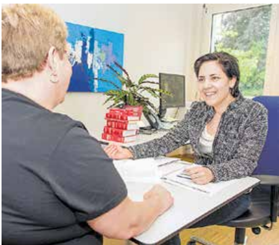
Die Konsumentenberatung der Arbeiterkammer steht nicht nur Mitgliedern offen.

Ohne Hilfe sehen sich manche Menschen nicht darüber hinaus, ihre Arbeitnehmerveranlagung richtig auszufüllen. Die Abteilung Steuerrecht bietet deshalb den AK-Mitgliedern Hilfe dabei an, ihr Geld vom Staat zurückzuholen. So unterstützten die AK-Experten im letzten Jahr mehr als 6400 Vorarlbergerinnen und Vorarlberger beim richtigen Ausfüllen der Arbeitnehmerveranlagung.