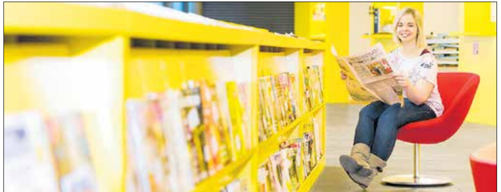
Die Arbeiterkammer bietet in ihren Bibliotheken in Feldkirch und Bludenz neben Büchern, Zeitungen und Magazinen auch CDs, DVDs und E-Books an.

Die AK-Konsumentenberatung verzeichnete im letzten Jahr mehr als 21.500 Beratungen in den verschiedensten Bereichen. Neben dubiosen Inkassobüros oder unbestellten Warensendungen über die Prüfung von Mietverträgen bis hin zur überhöhten Handyrechnung. Deshalb finden sich auf der Homepage der AK Vorarlberg auch zahlreiche Tipps unter dem Stichwort Konsumentenschutz.