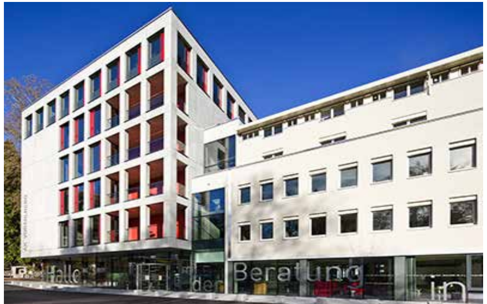
Direkt an der Bärenkreuzung: Die AK Vorarlberg, das BFI der AK Vorarlberg und die AK-Bibliothek gesammelt an einem Standort.

Direkt im Zentrum, an der Bärenkreuzung. Widnau 2-4, 6800 Feldkirch Telefon 050/258 oder 05522/306 DW 0, Fax 050/258 oder 05522/306 DW 1001, kontakt@ak-vorarlberg.at